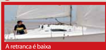
A retranca é baixa