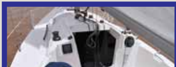
Cockpit bem distribuído