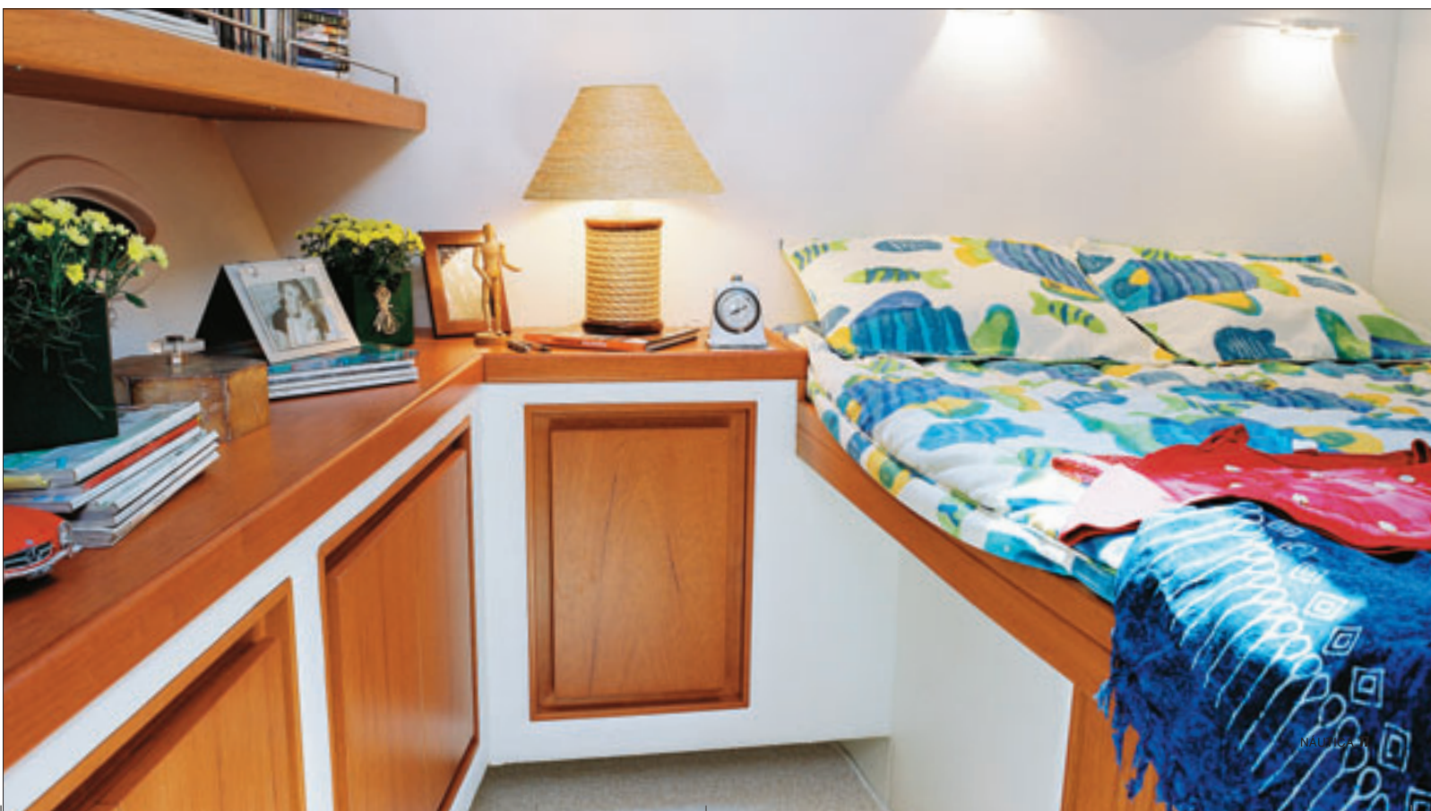
Camarote Localizada a bombordo, a suíte do proprietário tem 2,08 de pé-direito e armários de muito boa qualidade