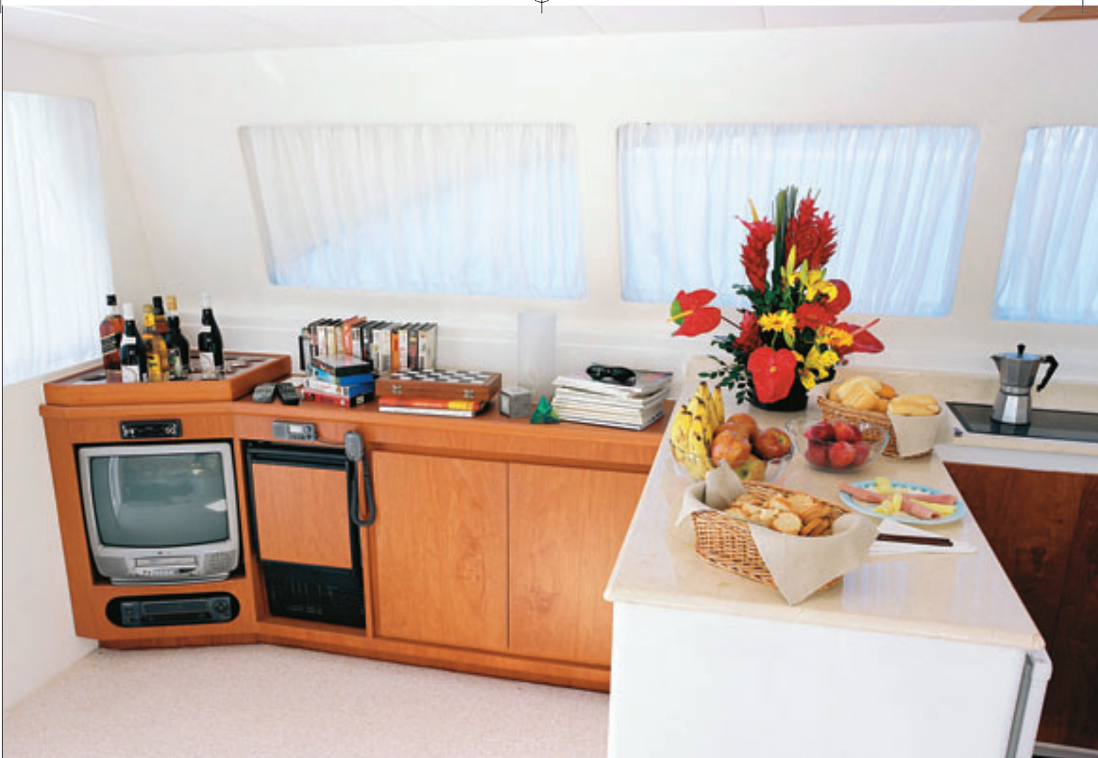
Salão Com espaço para vários aparelhos, a sala — com 2 m de pé-direito — pode ser personalizada pelo proprietário