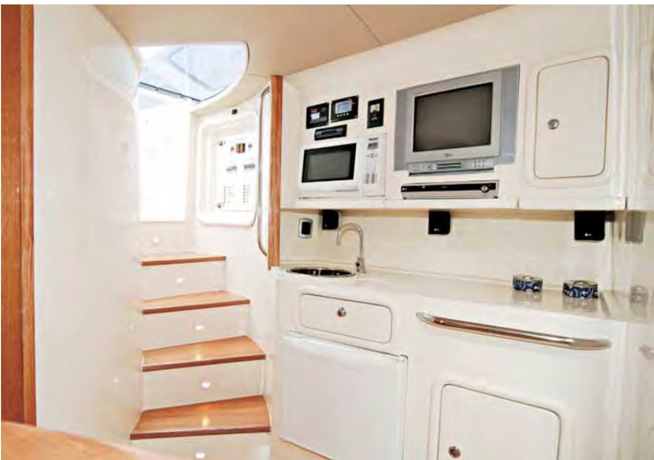
ESPAÇOSA A cozinha tem microondas e geladeira. Mas seu ponto alto é a bancada, que é bem grande para o tamanho da lancha