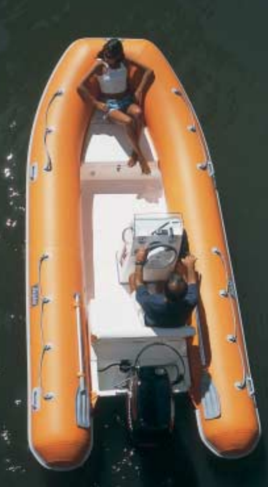
O cockpit é bem aproveitado para o porte do barco