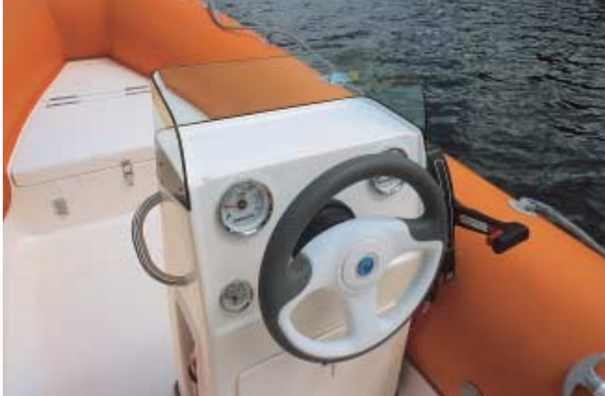
O console lateral tem espaço para bússola, sonda e GPS

no console para dois relógios grandes e três pequenos, além de uma alça e lugar para o extintor de incêndio (do tipo utilizado nos automóveis). Há também lugar no painel para bússola, sonda e um GPS pequeno. Dá para utilizar um rádio VHF portátil ou trocar um dos eletrônicos por um rádio VHF fixo. A posição de pilotagem é confortável. Na proa, fica o compartimento para uma pequena âncora e a amarra.