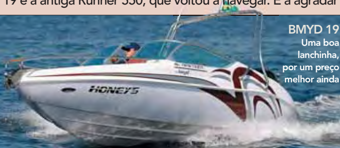
BMYD 19 Uma boa lanchinha, por um preço melhor ainda

Outra herança da extinta Runner, hoje resgatada pelo estaleiro Bmyd, é uma lanchinha de 19 pés, para águas abrigadas, cujo maior atrativo é o preço: sai por R$ 51 000, com motor de popa quatro tempos de 90 hp, pronta para navegar — ou até mais em conta, se o motor for de dois tempos, com menor potência. O casco da Bmyd 19, como ela hoje se chama, é o mesmo da Runner 550, que fez muito sucesso nos anos 90. Na nossa avaliação, chegou a 33,2 nós de velocidade máxima, com este motor de 90 hp, e mostrou ser adequada para até seis pessoas a bordo ou até mesmo para puxar um esquiador, se estiver com meia lotação. Resumindo: uma boa opção.