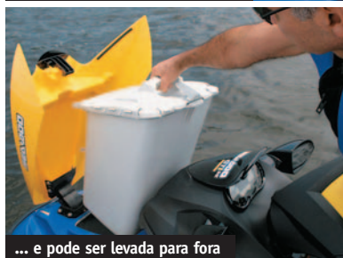
... e pode ser levada para fora