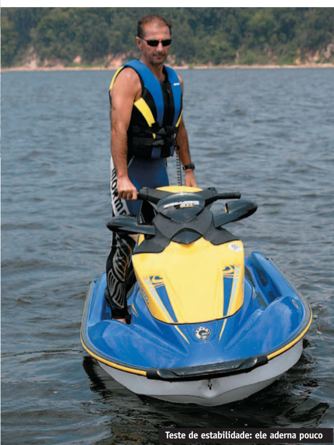
Teste de estabilidade: ele aderna pouco

FACILIDADES Além do painel com todos os comandos à mostra o tempo todo, este jet é muito estável, o que é bom para quem quer apenas passear com tranquilidade e segurança