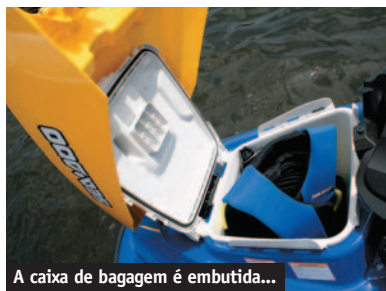
A caixa de bagagem é embutida...