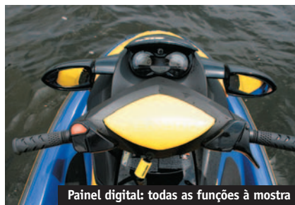
Painel digital: todas as funções à mostra