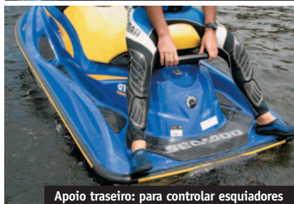
Apoio traseiro: para controlar esquiadores