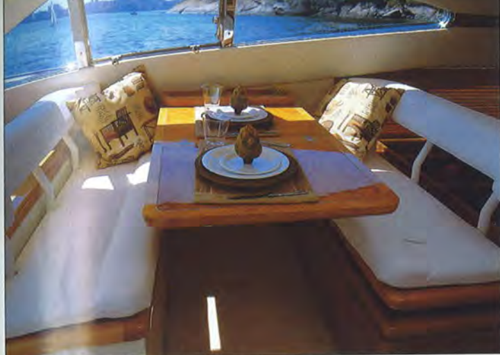
Dinete Tem visão privilegiada a vante e para os bordos

(uma suíte com cama de casal e duas cabines com camas de solteiro que dividem o banheiro de bombordo). O pé-direito nos camarotes é alto (mínimo de 1,99 m) e o material utilizado é de qualidade, com design aprimorado. Tudo na medida, enfim, para proporcionar o repouso necessário para quem passa o dia usufruindo as delícias do mar.